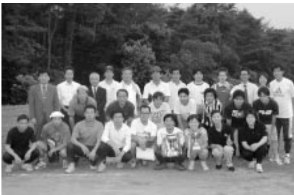
一般の部及び混合の部で優勝した病院部管理課