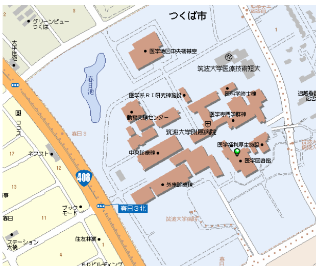
国際シンポジウム・講演会会場 (臨床講義室A)