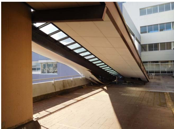
1B棟側見た崩落した屋根