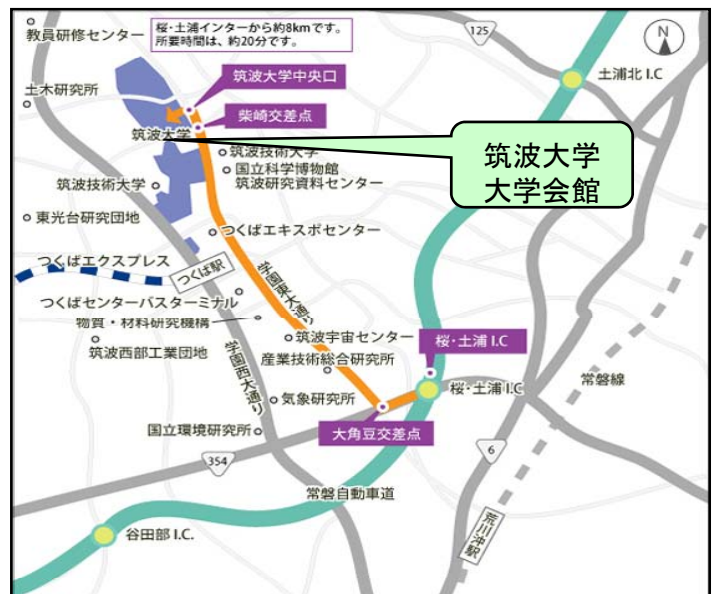
筑波大学 大学会館:TXつくば駅下車、筑波大学循環右回りバス乗車、筑波大学大学会館前下車徒歩1分

主催者 筑波大学北アフリカ研究センター、筑波大学北アフリカ・地中海連携センター 連絡先 筑波大学北アフリカ研究センター Tel:029-853-3982 Fax:029-853-5776 email: arena@un.tsukuba.ac.jp