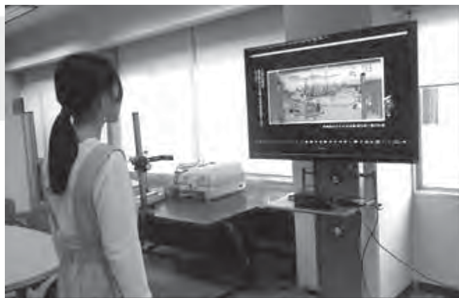
デジタル展示のイメージ