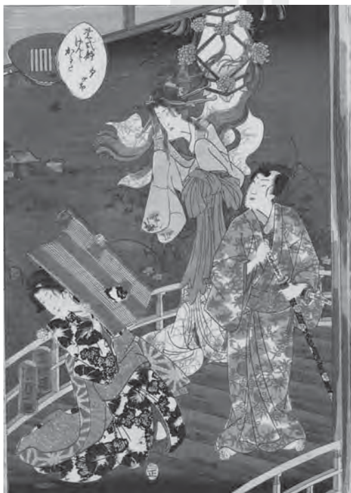
歌川国貞 『紫式部源氏かるた』 4 「夕がほ」