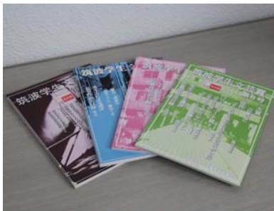
これまでの「筑波学生文芸賞」の冊子 (5月9日、筑波大学附属中央図書館)

つくばに住む大学生から文学賞応募、優秀な作品を決める。第9回筑波学生文芸賞の募集が、5月1日から7月15日まで行われている。大賞作品にはスターバックスクラード5000円分が贈呈される。今年度は公募委員に設立した。現在、筑