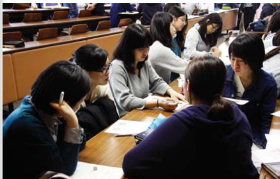
今年の参院選で想定される争点について話し合う学生たち(4月27日、1H棟)