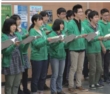
美しい歌声を披露する団員たち (4月22日、第三エリア食堂)

筑波大学混声合唱団の新入生歓迎コンサートが4月22日、第三エリア食堂で行われ、筑波大の学生歌「常陸のつばき」6曲を披露。合唱団は、新入生歓迎の歌声を届けた。2曲目に歌われた「ぜんぶはテレリア」は、ちびまも子ちゃん(原作者)の歌声で、自然の雄大さと表露した。