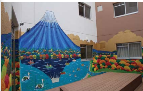
改装されたショートステイハウスの中庭(5月2日、一の矢宿舍35号棟で)