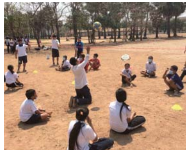
シットングバレーボールを楽しむ現地の子どもたち

障がい者スポーツを通じて、途上国での障がい者理解を深めよう。筑波大学体育系は国際協力機構(JICA)と協力し、2015年以降、年2回体育系学生をカンボジアに短期派遣している。