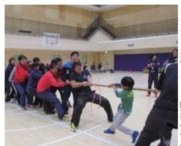
つくりんピックでスポーツを楽しむ参加者たち。障がいの程度に関わらず、子どもと学生が網羅的に参加する=齊藤まゆみ准教授提供

を履修する。ただし、心のコンディショニングが理由で通常開講科目の履修が難しい学生は、トリム運動が選択できる。トリム運動は、その人が出来る運動」を行う。障がいのある学生はトリム運動を受講し、適切な指導を受ける。障がいの程度に関わらず、子どもと学生が網羅的に参加する=齊藤まゆみ准教授提供