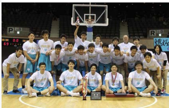
優勝した筑波大男子バスケット部(5月8日、国立代々木競技場第二体育館で)