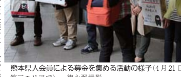
熊本地震を受け、筑波大の学内外で募金活動の様子(4月21日、第三エリアで)

熊本地震を受け、筑波大は熊本地震を受け、筑波大の学内外で募金活動も行う。熊本地震を受け、筑波大の学内外で募金活動も行う。熊本地震を受け、筑波大の学内外で募金活動も行う。