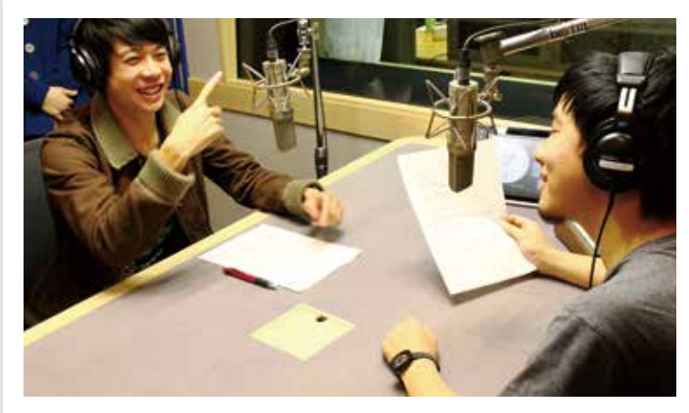
Bayfm78の収録ブースにて

Bayfm78 で放送した「筑波大学ラジオ CM 電話相談窓口編」が、日本最大級の広告賞「2017 57th ACC CM FESTIVAL」（一般社団法人 全日本シーエム放送連盟主催）で、ACC 地域ファイナリストに選ばれました。応募本数 570 作品、プロがひしめく中、学生制作のラジオ CM の入賞は 4 回連続の快挙です。