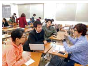
アドバンスト 授業風景