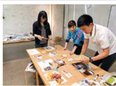
ベーシック 授業風景