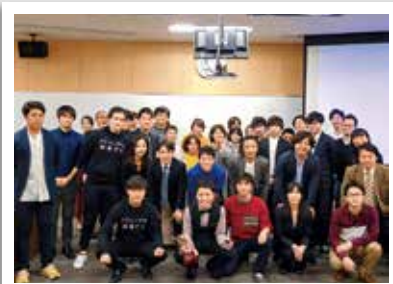
アドバンスト 起業プラン発表会