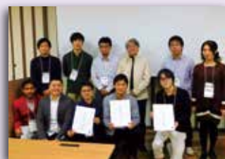
(H29年度 発展編プログラムの様子)

EDGE-NEXT プログラムについて、詳しくは筑波大学国際産学連携本部 WEB サイト ( https://www.sanrenhonbu.tsukuba.ac.jp ) をご覧ください。