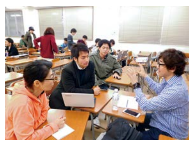
アドバンスト 授業風景