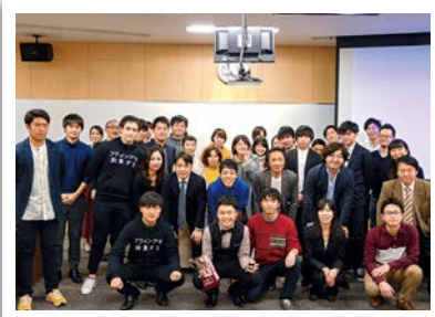
アドバンスト 起業プラン発表会