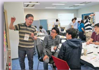
(H30年度 基礎編プログラムの様子)

EDGE-NEXT プログラムについて、詳しくは筑波大学国際産学連携本部 WEB サイト ( https://www.sanrenhonbu.tsukuba.ac.jp ) をご覧ください。