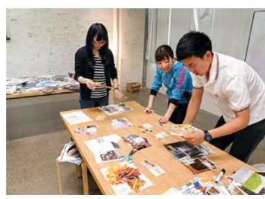
ベーシック 授業風景