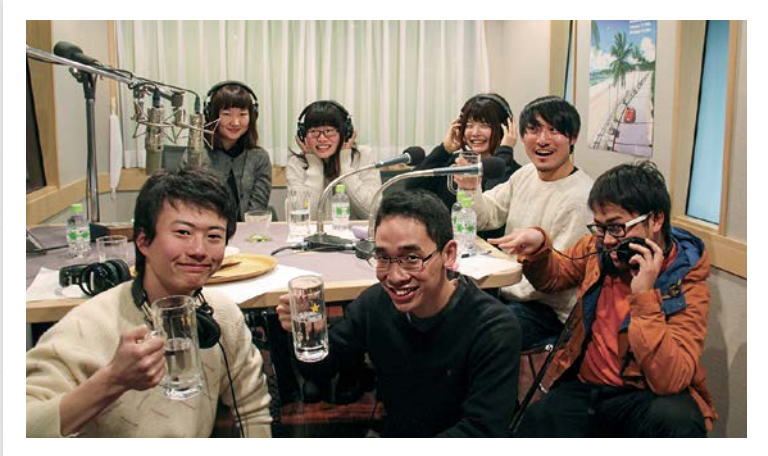
Bayfm78の収録ブースにて

Bayfm78 で放送した「筑波大学ラジオ CM それって編」が、日本最大級の広告賞「2016 56th ACC CM FESTIVAL」（一般社団法人 全日本シーエム放送連盟主催）で、ACC 地域ファイナリストに選ばれました。応募本数 570 作品、プロがひしめく中、学生制作のラジオ CM の入賞は 3 回連続の快挙です。