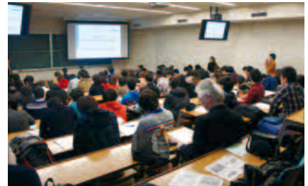
写真は昨年度までの授業風景です。

プロフィール 新日鐵(現 日本製鉄)に入社し、主に鋼材の営業を担当。分野は、建築・土木、造船、建設機械、産業機械、地域は、東京、大阪、名古屋とそれぞれ幅広く担当。2012年からの5年間は、新日鐵子会社にて、経営を担う。趣味は、ゴルフ、読書、散歩に芸術鑑賞を加えるべく、勉強中。