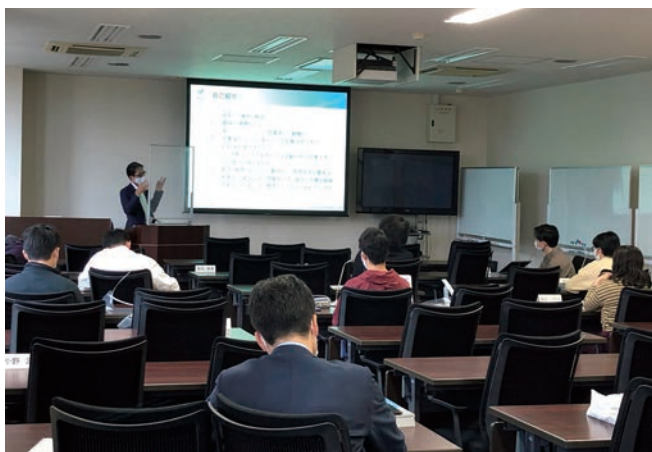
写真は昨年度までの授業風景です。

第1回、第2回の講義を通して検討した内容を前提に、次世代モビリティ、スマートシティによる市場デザインと未来社会像についてグループワーク、パネルディスカッションを実施。パネルには最前線で活躍する有識者の参加を予定。