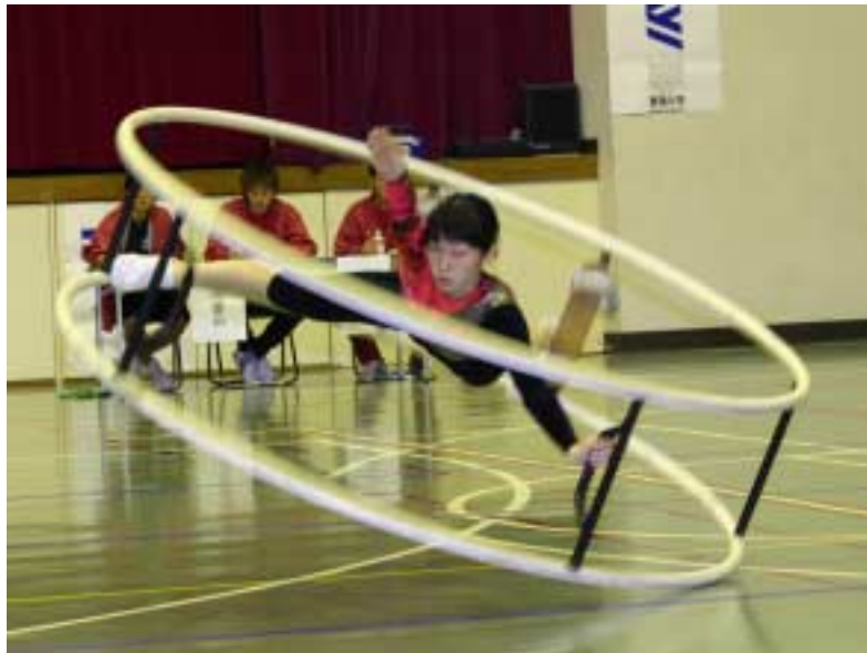
第10回全日本ラート競技選手権大会が11月6、7の両日、静岡県沼津市の東海大学体育館で開催され、森、深瀬 個人総合で優勝

12月17日午後6時半から、1D204 20日午後6時から、図情205講義室 21日午後6時から、大会館国際会議室