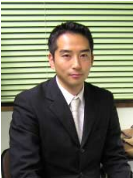
「教育問題に取り組みたい」と意欲を燃やす研究室で