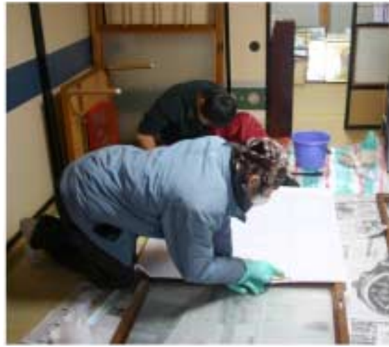
被害にあった家屋で障子張りを手伝う

新潟県中越地震の被災者を手助けしようと、本学生が現地ボランティア活動に参加している。12月5日には有志がALAガーター(つくば)つくば市松代)でチャリティーコンサートを開いたほか、現地のボランティア情報を提供するサークルが現れるなど、支援の輪が広がっている。