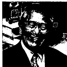
米パデュー大学 根岸 英一特別教授 (帝人グループ名誉フェロー) 帝人久村奨学生第5回生(1957年)

そして自らの「夢」を見つけたら真理を突き詰めるまで、とことんチャレンジしてください。今後の皆さんの大いなる活躍に期待しています。