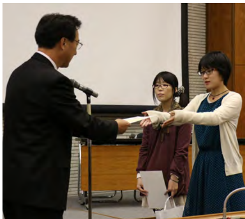
「Women's Hackathon at Tsukuba」を企画し、最優秀賞を受賞した学生(11月11日、大学会館で)

T・ACT(つくばアクションプロジェクト)の公開シンポジウムが、11月11日に大学会館で行われた。学生や教職員、地域の市民団体関係者など約100人が会場を訪れ、こ