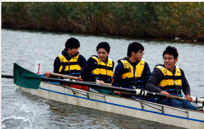
声を掛け合ってオールを漕ぐ参加者 (11月8日、桜川で)