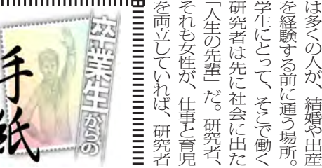
筑波大学新聞、こんな新聞があるなんて!。恥ずかしながら、今回の原稿の依頼を受けるまで、全く知りませんでした。せんえつながら、奇稿させていただきます。

手紙 筑波大学新聞、こんな新聞があるなんて!。恥ずかしながら、今回の原稿の依頼を受けるまで、全く知りませんでした。せんえつながら、奇稿させていただきます。 私は、2004年に人間学類(現在の人間学群心理学類)に入学し、心理学や特別支援教育を学