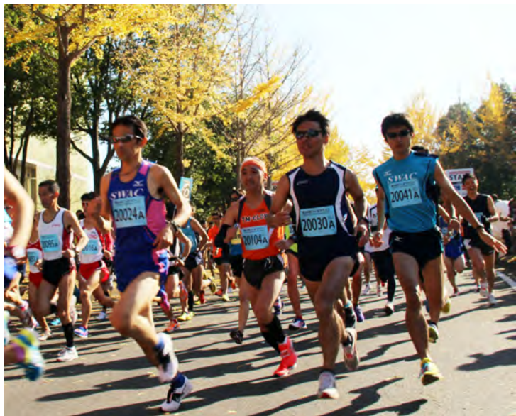
11月23日につくば市で開催された「つくばマラソン」。曇一つない秋空の下、1万3763人のランナーが、紅葉に染まるつくば路を駆け、沿道で応援する市民に笑顔で手を振り応えた。(田中開二教育学類1年、写真も)

「BBCワールドニュース」はイギリスの公共放送「BBC」が配信する。世界200以上の国や地域で視聴されている。玄関近くに設置されたテレビモニターで学生は常時、英語のニュースを見ることができ