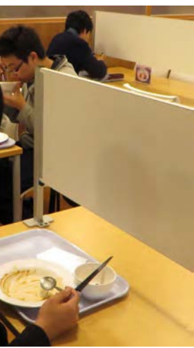
京大に導入された「ぼっち席」(11月7日、京大吉田キャンパスで)

京都大学の吉田キャンパス(京都市左京区)の中央食堂には、テーブルの真ん中についたてを立てた一人用の席(横並び3人がけ)がある。「周りの視線が気にならない席がほしい」などの要望に応えたものだ。学生からは「ぼっち席」と呼ばれ、全国の大学にも広がっている。若者から支持を集める理由は何なのか。食堂を運営する同大の生活協同組合や学生へのインタビューを通じ、ぼっち席の効果を探った。