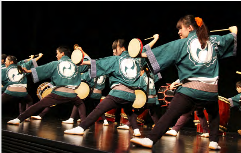
力強い太鼓の音を響かせる団員 (11月26日、つくばカピオで)