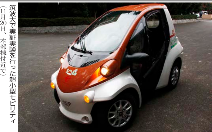
筑波大で実証実験を行った超小型モビリティ(11月20日、本部棟付近で)

同施設は、国内初の屋外大規模実証施設(つくば市栗原)の一般公開が11月23日に行われた。来場者は顕微鏡で藻類の細胞の構造を観察したり、バイオ燃料の解説ヒ