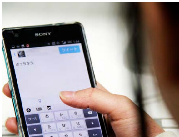
ツイッターには「ぼっち飯」などのつぶやきが並ぶ

筑波大の日本人学生から「ぼっち」という言葉が急速に普及した背景は何だろうか。筑波大学などで取材した(鈴木木拓也、廣岡里穂)人文学類、林健太郎、平嶋健人)社会学類、添島香苗)生物学類)