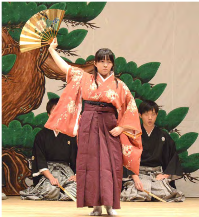
舞を披露する能・狂言研究会の学生 (11月16日、亀城プラザで)