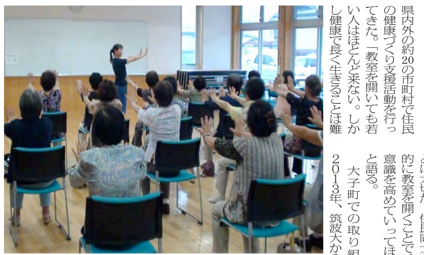
「大子町健康づくり講演会」で研究員から運動指導を受ける大子町住民

「アドバイザー」として養成する社会貢献プロジェクトを続けている。40〜80代の男女を対象に年に8回研修会を開き、6年間で計53人のアドバイザーを育成した。研修後、筆記試験に合格すれば正式にアドバイザーとして認定され、指導ができる。