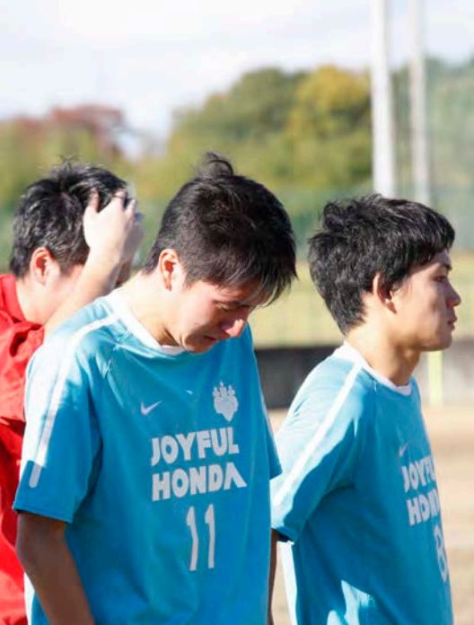
降格が決まり、うなだれる筑波大選手 (11月15日、中央大戦で)

関東大学サッカー部リーグの最終節が11月15日に古河市立古河サッカー場(茨城県古河市)で行われ、筑波大は中央大に1-2で惜敗した。筑波大は降格圏の11位に順位を落とし、戦後初の2部降格が決まった。来季は2部リーグで、1部復帰を目指す。(森脇慎二 社会学類2年、写真も。8面に関連記事)